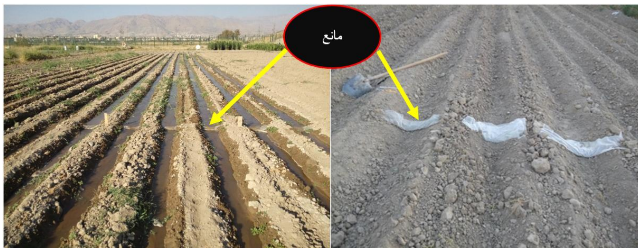
شکل ۱- نمایی از چویچه‌های آزمایشی و موانع ایجاد شده در آن

شیب چویچه‌ها برابر ۰/۹۶ درصد به دست آمد. در تمام آزمایش‌ها، هر سه چویچه آبیاری شدند و اندازه‌گیری‌ها در چویچه وسط انجام شد. چویچه‌های کناری به عنوان چویچه‌های محافظ و برای در نظر گرفتن اثر حاشیه‌ای و ایجاد شرایط واقعی، لحاظ شدند. چویچه‌ها انتها باز در نظر گرفته شدند. در این تحقیق، برای اندازه‌گیری دبی جریان ورودی و رواناب خروجی از چویچه‌ها، از فلوم