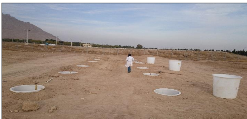
شکل ۲- جایگذاری مخازن در مزرعه دانشگاه صنعتی اصفهان