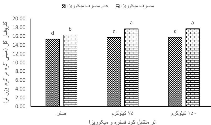
شکل ۳: مقایسه میانگین اثرات متقابل کود فسفره و میکوریزا بر کلروفیل کل ماش