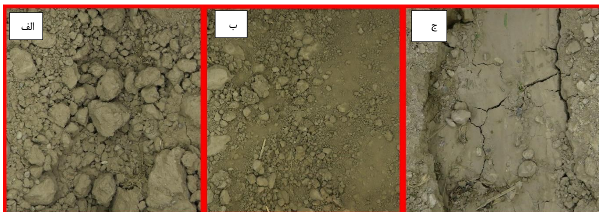
شکل ۱. نمونه‌ای از تصاویر استفاده‌شده برای تعیین شاخص اندازه و تعداد کلوخه‌ها قبل از آبیاری (الف: کلوخه زیاد، ب: کلوخه متوسط، ج: کلوخه کم)

برای بررسی دقت رابطه بین پارامترهای مختلف و ضریب زبری مانینگ در فازهای مختلف، کلیه داده‌ها به دو بخش آموزش و آزمون تقسیم شدند. بدین منظور ۸۰ درصد از داده‌ها برای آموزش و ۲۰ درصد برای آزمون مورد استفاده قرار گرفتند سپس با بررسی شاخص‌های آماری RMSE ، R^2 و NRMSE در داده‌های آموزش و آزمون بهترین معادلات در فازهای پیشروی، ذخیره و کل رخداد آبیاری استخراج شد.