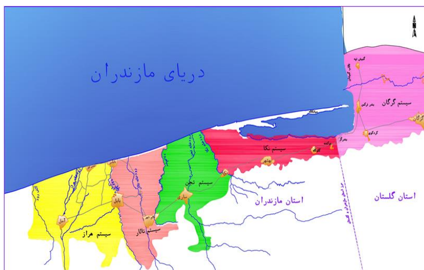
شکل ۱. محدوده عمومی سیستم‌های مطالعاتی

مساحت اراضی آبی در سیستم هراز ۹۶۳۵۷ هکتار، در سیستم تالار ۶۰۴۱۲ هکتار و در سیستم تجن ۶۳۷۹۷ هکتار و جمعاً در این سه سیستم مطالعاتی (حوضه مبدا) معادل ۲۲۰۵۶۶ هکتار را شامل می‌شود.