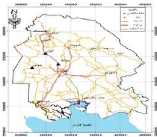
شکل ۱. نقشه موقعیت مکانهای نمونه‌برداری

و اقتصادی وارد می‌کند، بدین منظور از سه محدوده از کانون‌های بحران‌زای فرسایش بادی در استان خوزستان شامل منطقه روبروی بروایه (که خاک آن محدوده ماسه‌بادی بوده و شدت فرسایش بادی در آن به حدی است که ریشه برخی درختان در سطح خاک نمایان گردیده است) با مختصات 31^{\circ}57' عرض شمالی، 48^{\circ} طول شرقی و 31^{\circ}91' عرض شمالی و منطقه هویزه با مختصات 31^{\circ}63' عرض شمالی، 48^{\circ}9' طول شرقی (تا عمق ۵ سانتیمتری) از نقاط بدون پوشش گیاهی و از محل‌هایی صورت پذیرفت که هیچ‌گونه عارضه‌ای در مسیر جریان باد قرار نداشت. تصویر موقعیت نمونه‌برداری‌ها در شکل شماره یک نشان داده شده است. سپس نمونه‌ها به آزمایشگاه منتقل گردید.