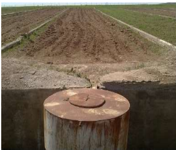
شکل ۲. شمای کلی کرت‌های آزمایشی و مخازن جمع‌آوری رواناب و رسوب

ویژگی‌هایی از قبیل درصد تاج پوشش گیاهی، ارتفاع گیاه و درصد علف‌های هرز نیز در هنگام اندازه‌گیری رواناب و رسوب در هر کرت اندازه‌گیری شد. درصد تاج پوشش گیاهی و درصد تراکم علف‌های هرز به‌صورت مستقیم (با استقرار پلات‌هایی به ابعاد ۱×۱ متر) در ۱۰ تکرار و ارتفاع گیاه به‌صورت میانگین ده بوته در هر کرت، از سطح خاک تا انتهای جوان‌ترین برگ و به‌وسیله خط‌کش مدرج، تعیین گردید. درصد سنگریزه نیز به‌صورت مستقیم با استقرار پلات‌هایی به ابعاد ۱×۱ متر در ۱۰ تکرار اندازه‌گیری شد. همچنین برخی از ویژگی‌های فیزیکی و شیمیایی خاک سطحی (۰-۳۰cm) کرت‌ها مثل بافت خاک به روش هیدرومتر (Gee and Or, 2002)، ماده آلی به روش والکلی-بلک اصلاح شده (Nelson and Sommer, 1982)، کربنات کلسیم معادل به روش خنثی‌سازی با اسید و تیتراژ کردن با سود (Richards, 1969)، EC در عصاره سوسپانسیون ۱:۱