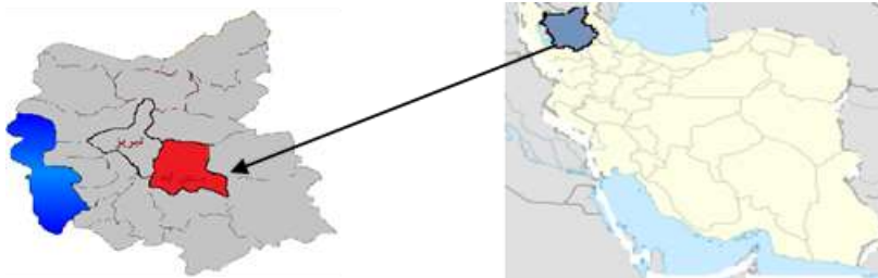
شکل ۱. نمایی از موقعیت منطقه مورد مطالعه در ایران و استان آذربایجان شرقی

از سطح دریا ۱۹۰۰ متر و متوسط بارندگی ده ساله ایستگاه ۳۸۶ میلی‌متر در سال می‌باشد. در منطقه تیمکمه‌دش گیاهان زراعی همچون گندم، جو، عدس و نخود توسط کشاورزان به روش سنتی (دست پاش) کشت می‌شوند. چون کشت گیاه